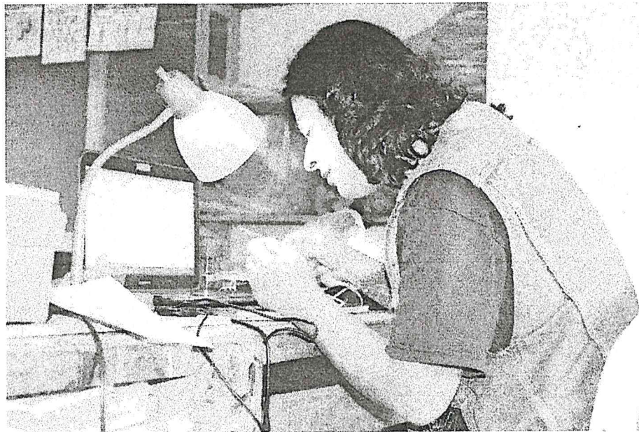
Figura 3. Análisis de material de obsidiana.